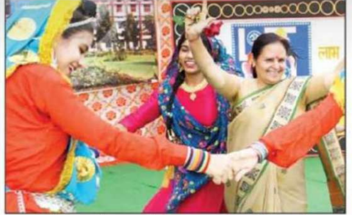
एचडी स्कूल में उल्लसपूर्वक मनाए गए दीपावली समारोह।